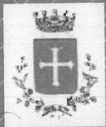
COMUNE DI PISA