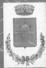
COMUNE DI CASCINA